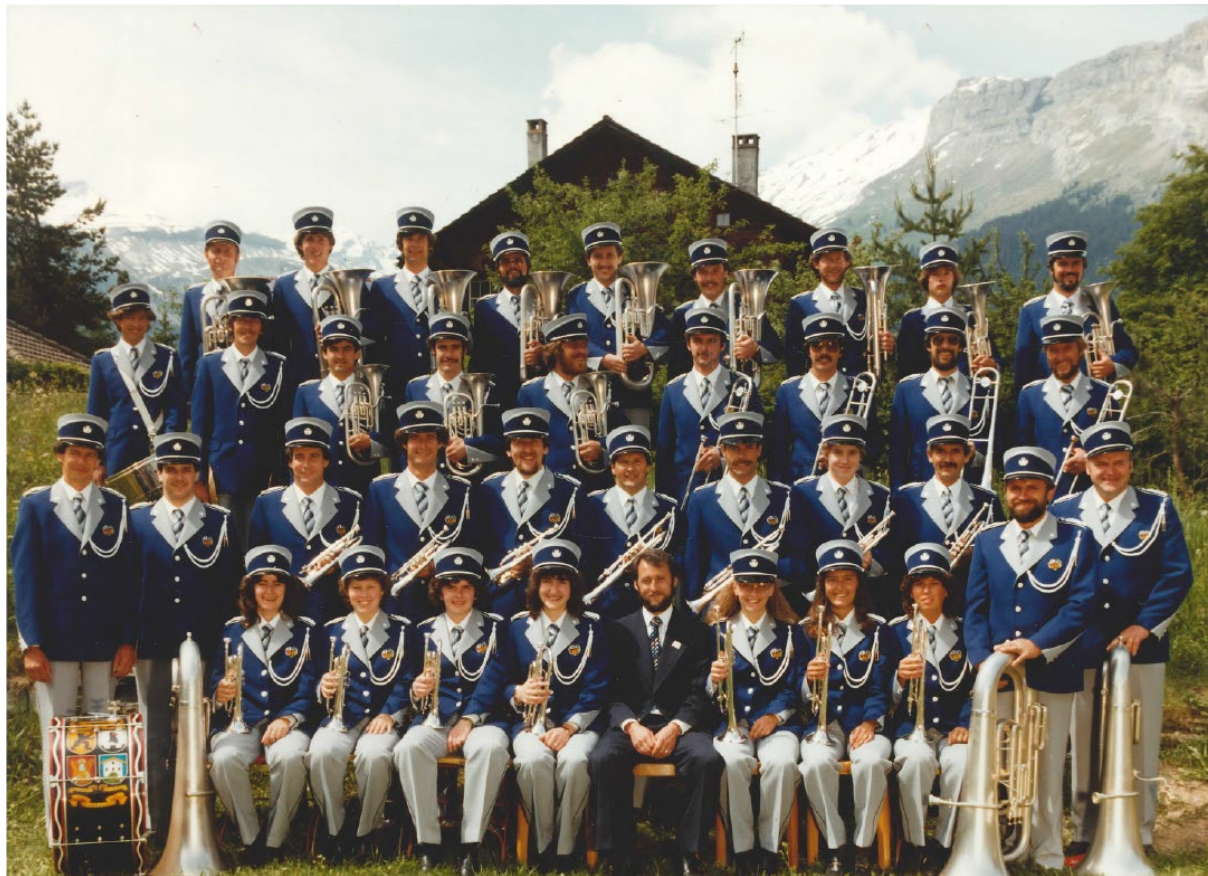
Maletg: 1983, emprema fotografia en uniforma nova