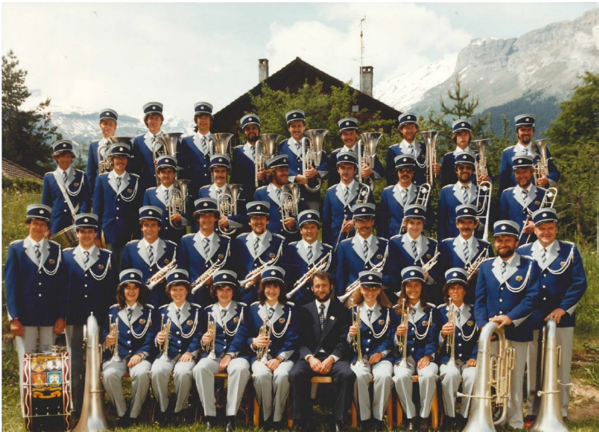
Bild: 1983, erstes Foto in der neuen Uniform